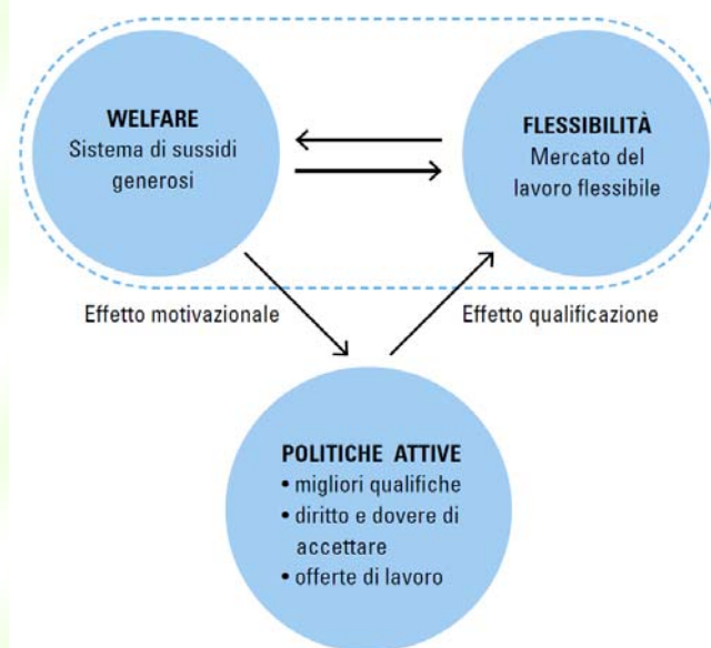
Figura 2. Il triangolo d'oro danese

Le innovazioni contrattuali, quali ad esempio quelle che attribuirebbero una funzione assicurativa agli enti bilaterali, non necessitano di chissà quale iniziativa legislativa nazionale e/o provinciale, ma della volontà negoziale delle parti sociali. Pertanto, potrebbero essere attivate anche "autonomamente" dalle parti sociali altoatesine attraverso un forte sostegno da parte dell'attore pubblico che le spinga a convergere in tale identità di vedute.