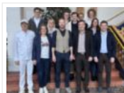
Schlüssel zur Zukunft