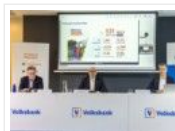
131 Millionen Euro Gewinn