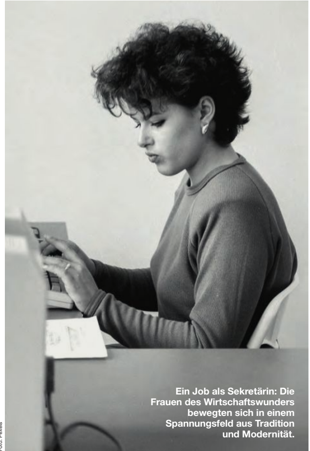
Ein Job als Sekretärin: Die Frauen des Wirtschaftswunders bewegten sich in einem Spannungsfeld aus Tradition und Modernität.

aus dem Jahr 2021 zeigt, dass einer wachsenden Zahl an Eltern die gemeinsame Betreuung und Erziehung der Kinder wichtig ist. Bald schon wird das Landesstatistikinstitut Astat eine Neuauflage vorlegen, wobei man heute schon davon ausgeht, dass Werte wie diese weiter im Steigen begriffen sind.