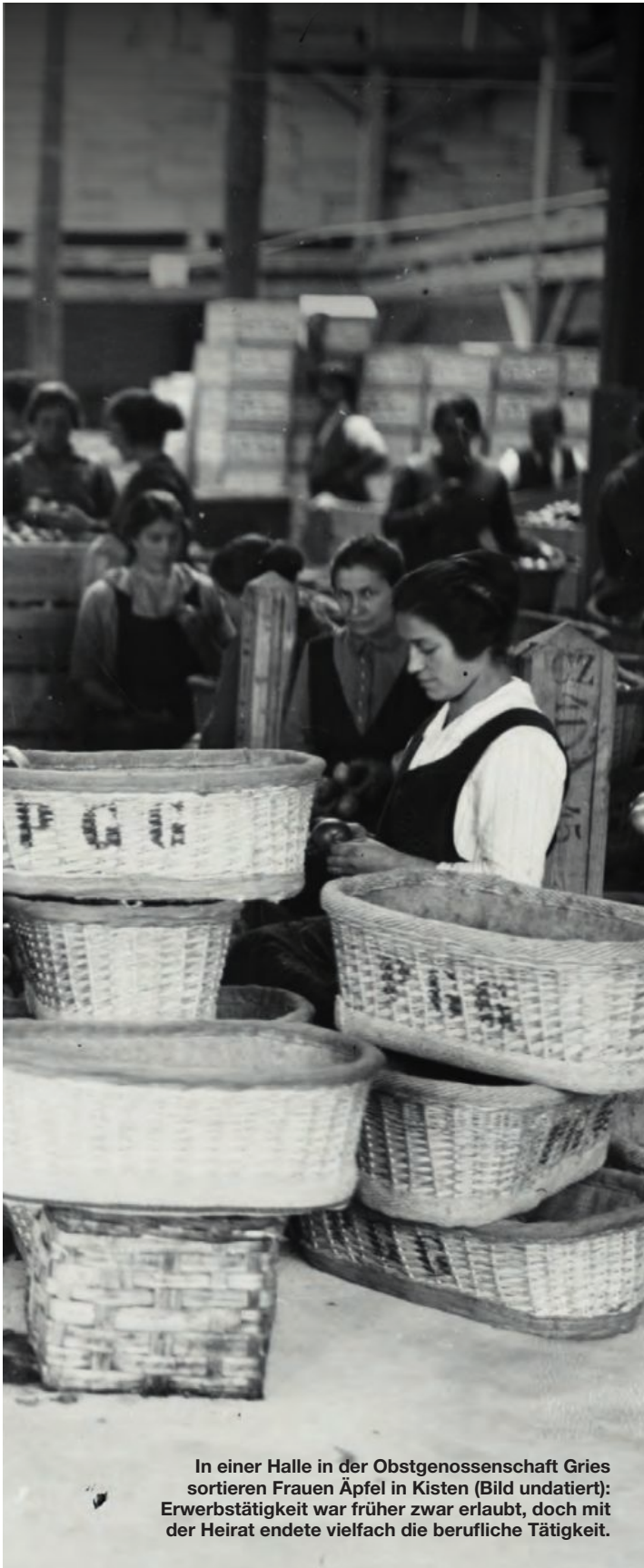
In einer Halle in der Obstgenossenschaft Gries sortieren Frauen Äpfel in Kisten (Bild undatiert): Erwerbstätigkeit war früher zwar erlaubt, doch mit der Heirat endete vielfach die berufliche Tätigkeit.

W enn ein Kind geboren wird, beginnt für viele Paare keine neue, sondern eine alte Ordnung. Während für Väter oft nur ein Abschnitt hinzugefügt wird, verschiebt sich für Mütter das gesamte Gefüge ihres Lebens. Aus Zeit wird Mangelware, aus Erwerbsarbeit ein Balanceakt, aus Gleichberechtigung ein Vertrösten auf unbestimmte Zeit.